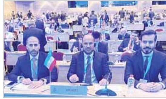
اللواء محمد الشرهان مترئساً وفد الكويت في الاجتماع

ترأس الوكيل المساعد لشؤون الأمن الجنائي اللواء محمد الشرهان ترأس وفد الكويت المشارك في الجمعية العامة للإنترنتبول في دورتها الـ "89" والتي بدأ انعقادها أمس ويستمر حتى غد في إسطنبول - تركيا. وقالت الإدارة العامة للعلاقات والإعلام الأمني بوزارة الداخلية، ان الأمين العام للإنترنتبول يورغن شوك وأمام 194 دولة شكر مشاركة في الجمعية دولة الكويت والدول المشاركة في عملية غبار الذهب التي نجحت فيها الكويت بضبط أمد أفراد التشكيل الإجرامي الذي ينشط في 16 دولة، بالتنسيق والتعاون بين الدول المشاركة تحت إشراف منظمة