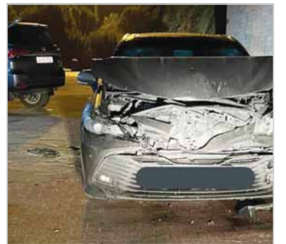
مركبة الشاب بعد إطلاق النار عليه واطلاقها في الجبراء