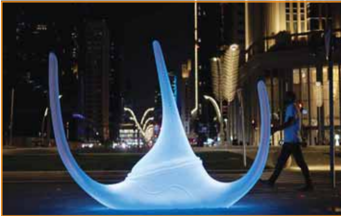
جانب من العمل المشارك