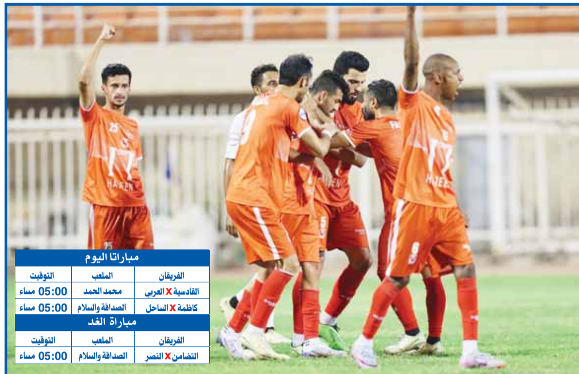
فرحة لاعبي الفحيحيل بالعودة مع كبار دوري زين

على الجانب الآخر، يبحث الساحل (13 نقطة) عن فوز جديد يحيي آماله فيه بعدم الهبوط إلى دوري الدرجة الأولى، ورغم أن فريق "أبناء أبو حليفة" يتخيل الترتيب، وتأكد تواجده في دوري "الأربعة"، إلا أن هذا الأمر لا يعني أنه سيكون صيداً سهلاً، حيث يحتاج الفريق لكل نقطة في المرحلة الحالية، للمحافظة على حظوظه في البقاء ضمن الدوري الممتاز في الموسم المقبل.