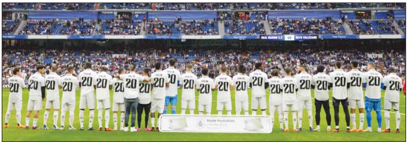
دعم كبير من لاعبي الريال لمزيمهم فينيسيوس

كرهية عبر شق دمية سوداء لنجم كرة القدم البرازيلي فينيسيوس جونيور على جسر بالعاصمة الإسبانية. وقررت المحكمة معاقبة الرجال، الذين يخضعون للتحقيق أيضاً في الإساءة إلى مهاجم ريال مدريد، منعه من التواصل أو الاقتراب من اللاعب لحين اكتمال تحقيقات أخرى. وفتح التحقيق بعد العثور على دمية مشنوقة ترتدي قميص فينيسيوس رقم 20 على جسر أمام مركز تدريبات ريال مدريد قبل مباراة قمة أمام أتليتيكو مدريد، في يناير الماضي. وبجانبها وضعت لافتة كبيرة حمراء وبيضاء، في إشارة إلى لوني فريق أتليتيكو، تقول "مريد تكرة ريال". وذكرت الشرطة الإسبانية أن ثلاثة من المعتقلين من أعضاء "رابطة متعصبة لجهامير أتليتيكو" وتم اعتبارها مصدر "خطورة كبيرة" في وقت سابق. وأضافت المحكمة أنها حظرت على المشتبه بهم الاقتراب من أماكن تدريبات ريال مدريد.