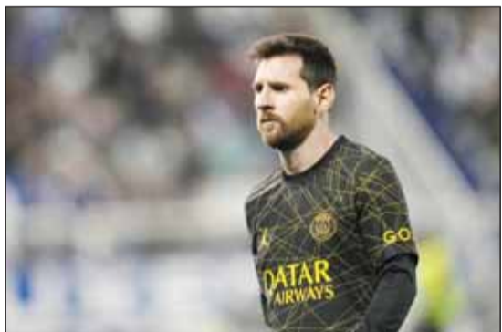
النجم الأرجنتيني ليونيل ميسي

كشفت تقرير صحفي إسباني، عن لقاء تم بين الأرجنتيني ليونيل ميسي، نجم باريس سان جيرمان، مع زملائه السابقين في صفوف برشلونة، خلال تناول العشاء. ويحسب صحيفة "موندو ديبورتيفو" الإسبانية، فإن العشاء كان الأسبوع الماضي في العاصمة الفرنسية باريس، حيث التقى ميسي، بسيرجيو بوسكيتس وجوردي ألبا وسيرجي روبرتو وزوجاتهم. واستغل قادة برشلونة الإجازة التي منحها تشافي هيرنانديز، المدير الفني لبرشلونة للاعبين بعد التتويج بلقب الليجا عقب الفوز على إسبانيول، في السفر إلى فرنسا. وأضافت الصحيفة، "اللاعبون لم ينشروا أي صور لهذا اللقاء على وسائل التواصل الاجتماعي، حيث انتهزوا الفرصة لتناول العشاء مع ميسي كأصدقاء مقربين". وأفاد التقرير، أن اللاعبين تحدثوا عن موقف كل منهم، وحين تم توجيه السؤال لميسي عن موضوع عودته لبرشلونة، كان رده واضحاً. لم ألتق أي عرض من النادي. وأشارت الصحيفة، إلى أن هذه هي الحقيقة، لأن برشلونة تنتظر الموافقة من الليجا قبل التحرك رسمياً، على الرغم من تقدم الهلال السعودي بعرض خيالي لميسي بقيمة 500 مليون يورو سنوياً (بحسب الصحيفة). وطالب نادي برشلونة، الحصول على استثناء من رابطة الدوري الإسباني، لرفع القيود عن الفريق والسماح له بتسجيل العقود الجديدة، وإبرام صفقات.