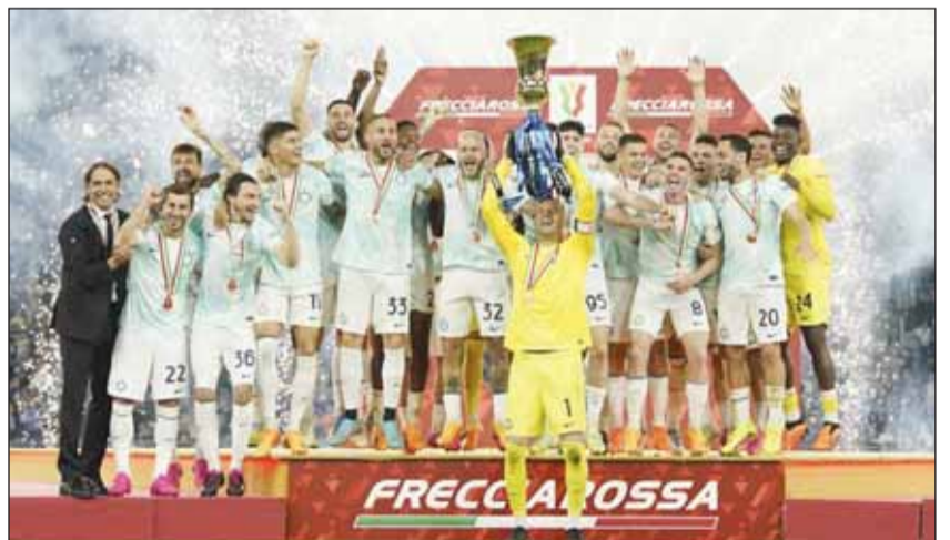
تتويج إنتر ميلان بلقب كأس إيطاليا للمرة التاسعة في تاريخه

إيطاليا للمرة الثالثة في مشواره التدريبي، حيث توج بالبطولة مرة مع لاتسيو ومرتين مع الإنتر. وأضافت أنه لا يتفوق على إنزاجي سوى 3 مدربين فقط، هم زفن غوران أريكسون، ماسيميليانو أليغري وروبرتو مانشيني، حيث فاز الثلاثي باللقب 4 مرات من قبل. في سياق متصل، قالت شبكة "سكواك" للإحصائيات، إن لاوتارو أحرز أهدافاً في الموسم الجاري (2022-2023) أكثر