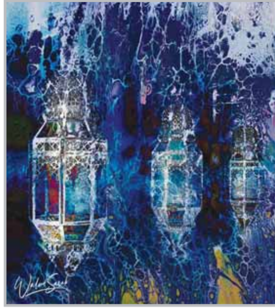
فوانيس لوليد سراب