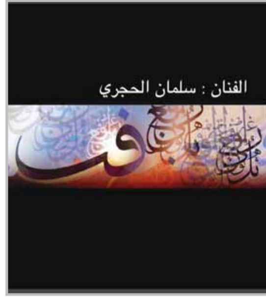
حروفيات رمضان للعماني سلمان الحجري